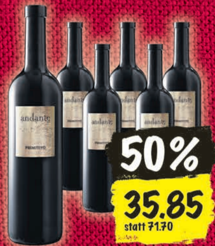
Primitivo del Salento IGT Andante 2014, 6×75 cl (10 cl = –80)

Jahrgangsänderungen vorbehalten. Coop verkauft keinen Alkohol an Jugendliche unter 18 Jahren.