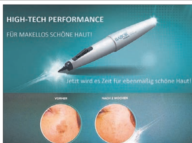
Das Hightechgerät aus dem Hause BABOR gegen Sonnen- und Pigmentflecken.

Lassen Sie sich unverbindlich bei uns beraten oder vereinbaren Sie eine Hautanalyse für umfangreiche Kenntnisse rund um Ihren Hautzustand. ● eing.