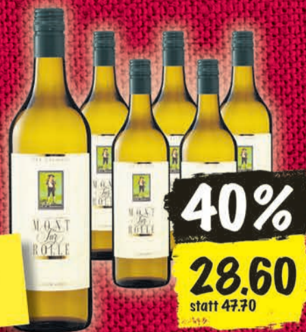
La Côte AOC Mont-sur-Rolle Le Charmeur 2014, 6×75 cl (10 cl = –64)